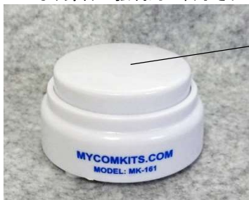
再生/録音兼用 スイッチ

◆録音する: ケースの上面すべてがスイッチになっています。ケース上面を「ピッ」という音がするまで（約2秒）押し続けます。録音状態になりますので、押したまま声を出して録音します。マイクは電源スイッチの右側あたりに実装されています。指を離すと録音を停止し、「ピピッ」となります。スイッチを押したままにした場合、約10秒後に「ピピッ」という音で録音用メモリがいっぱいになり録音が強制的に終了されたことを知らせます。