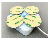
鉄板ステッカー4枚

・木製などのドアや壁に取り付ける場合は、付属の 4 枚の鉄板ステッカーの裏面の剥離紙(はくりし)をはがし、木製のドアや壁に貼り付け、その鉄板ステッカーに本装置を磁石で固定してください。